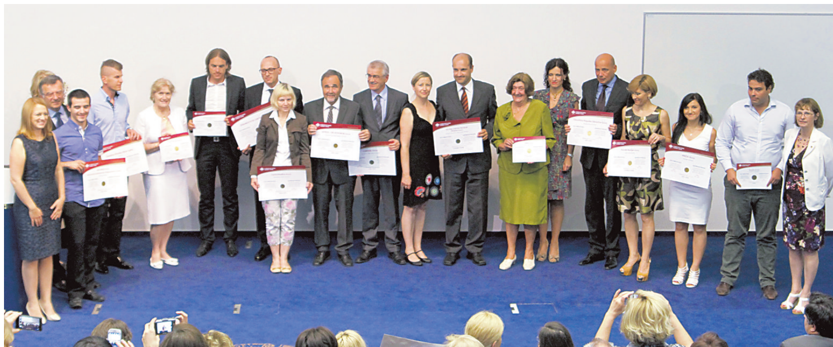
S podelitve akreditacij petnajstim zasebnim izvajalcem

Akreditacija za bolnika pomeni, da so postopki dela, ki so vezani na varnost in kakovost opravljanja storitev, v vseh akreditiranih organizacijah podobni in na zelo visoki kakovostni ravni. Pri tem moramo upoštevati, da akreditacijske ustanove ne presojujejo, ali je bila na primer neka diagnoza s profesionalnega vidika postavljena pravilno. Gre denimo za skrb za čistočo rok in preprečevanje širjenja infekcij, pomembnost identifikacije pacienta, pomembnost pravilne komunikacije znotraj zdravstvenega tima, skrb za varno delovno okolje in motivacijo zaposlenih, postopke, ki so vezani na predoperativne varnostne sezname, preprečevanje zamenjave zdravil, če omenim samo nekatere.